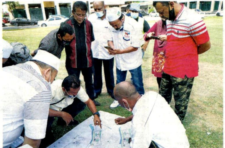
PENDUDUK Pangsapuri Seri Perantau dan kakitangan PKNS melihat pelan pembangunan semasa sesi lawatan Jabatan Urus Harta PKNS di pangsapuri tersebut di Pelabuhan Klang, Selangor semalam.

Mengulas lanjut mengenai lawatan pihak PKNS, Shawal berkata, penduduk sentiasa bekerjasama dengan anak syarikat kerajaan negeri itu untuk memastikan proses mendapatkan geran strata disejajarkan.