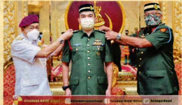
Sultan Sharafuddin (kiri) berkenan berangkat ke Majlis Pemakaian Kenaikan Pangkat Leftenan kepada Kapten untuk Tengku Amir Shah di Istana Alam Shah, Klang pada Isnin.

"Setelah memakai pangkat Kapten, baginda kekal di Batalion ke-17 Rejimen Askar Melayu Diraja RAMD (Para)," menurut kenyataan tersebut. - Bernama