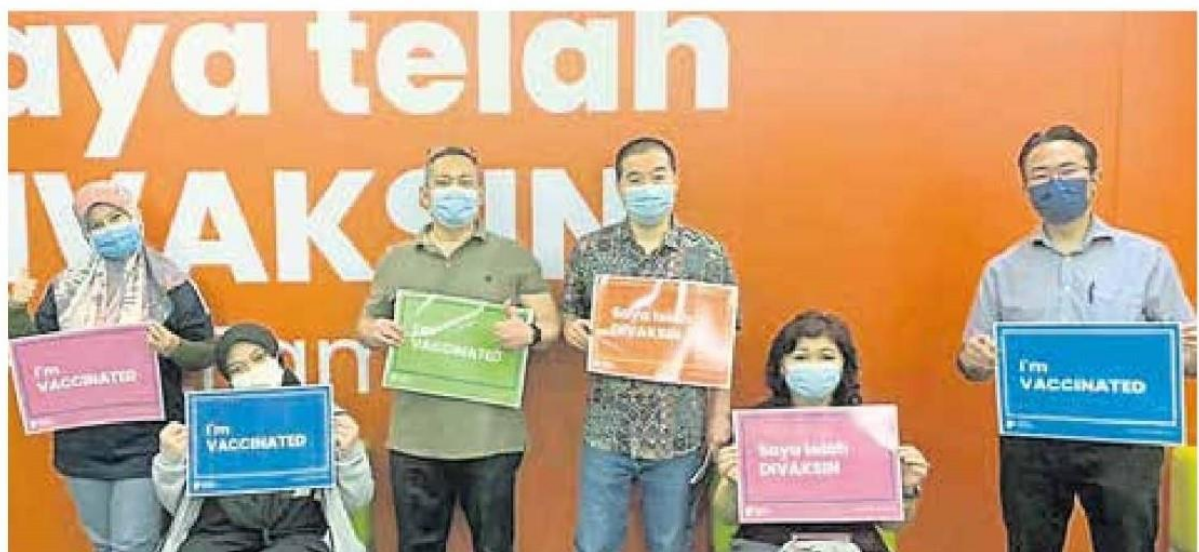
■ 班台医院及KPJ Tawakkal专科医院共有逾800名医护人员完成疫苗接种。

“接受第一剂辉瑞疫苗的前线人员都由联邦直辖区卫生局确定名单, 而疫苗接种者是该州不同私立医院的医护人员。” (TKM)