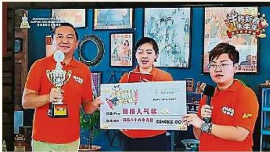
双溪比力新村在雪州“新村点缀新村比赛”中赢得“网络人气奖”。