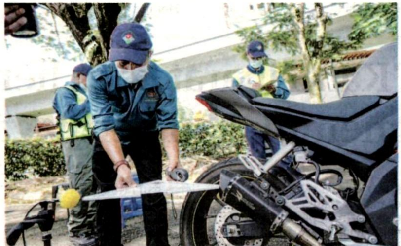
KAKITANGAN Jabatan Alam Sekitar memeriksa ekzos motosikal dalam operasi bersepadu di Tolm Batu 9, Cheras, Selangor semalam.

Zulkefly berkata, kesemua yang ditahan dikesan melakukan pengubahsuaian kenderaan tanpa kebenaran dan ekzos bunyi bising melebihi paras ditetapkan.