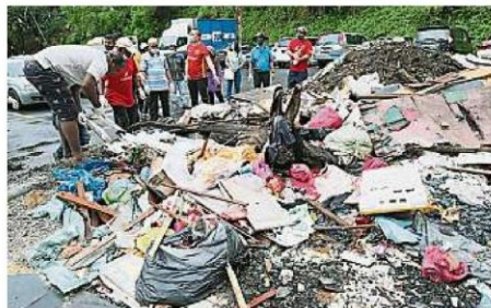
居民建议组屋的垃圾堆处改造为社区菜园, 以改善垃圾乱丢现象。