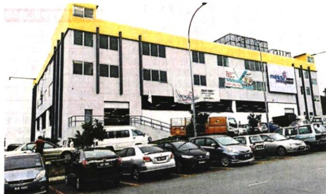
■談論了11年的皇冠城巴剎計劃，終在3月2日落實啟用。